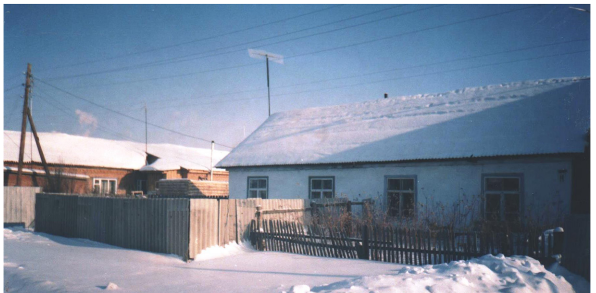
Первое здание д/сада. 1951 г. Слева – вновь построенное здание д/с. 1966. В нем размещалось три группы. В то время стены были оштукатурены, побелены в белый цвет, окна были деревянные.